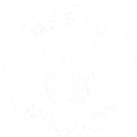
Rostislav Košťál Starosta města